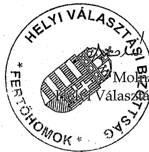
Molnár Péterné Helyi Választási Bizottság elnöke